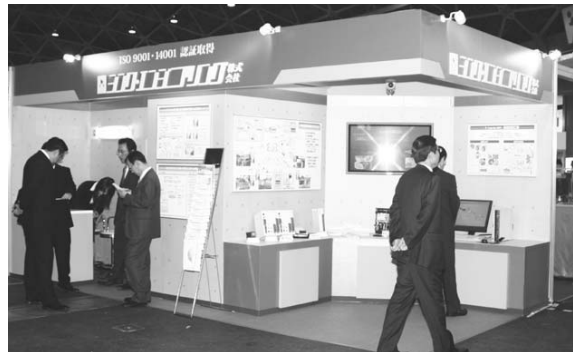
シンク・エンジニアリング