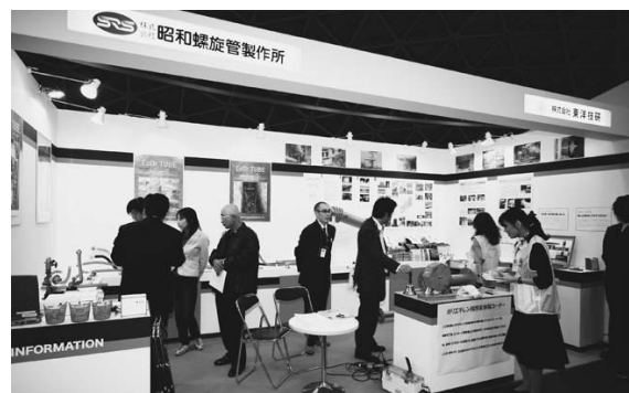
昭和螺旋管製作所/東洋技研