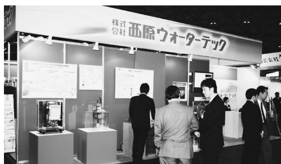
西原ウォーターテック