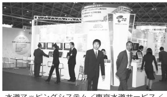
水道マッピングシステム/東京水道サービス/PUC